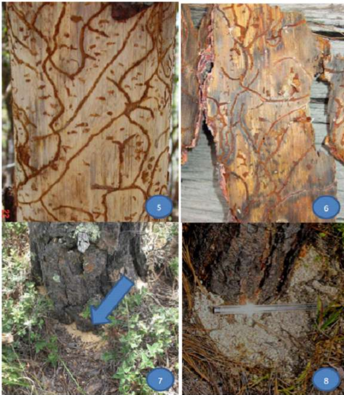
Fotografía 5.- Galerías por descortezadores en la zona del cámbium. 6.- Corteza desprendida, sobre su interior también se aprecian las galerías. Fotografías 7 y 8.- Sobre la base del fuste del arbolado infestado, se aprecian gránulos de resina cristalizada.