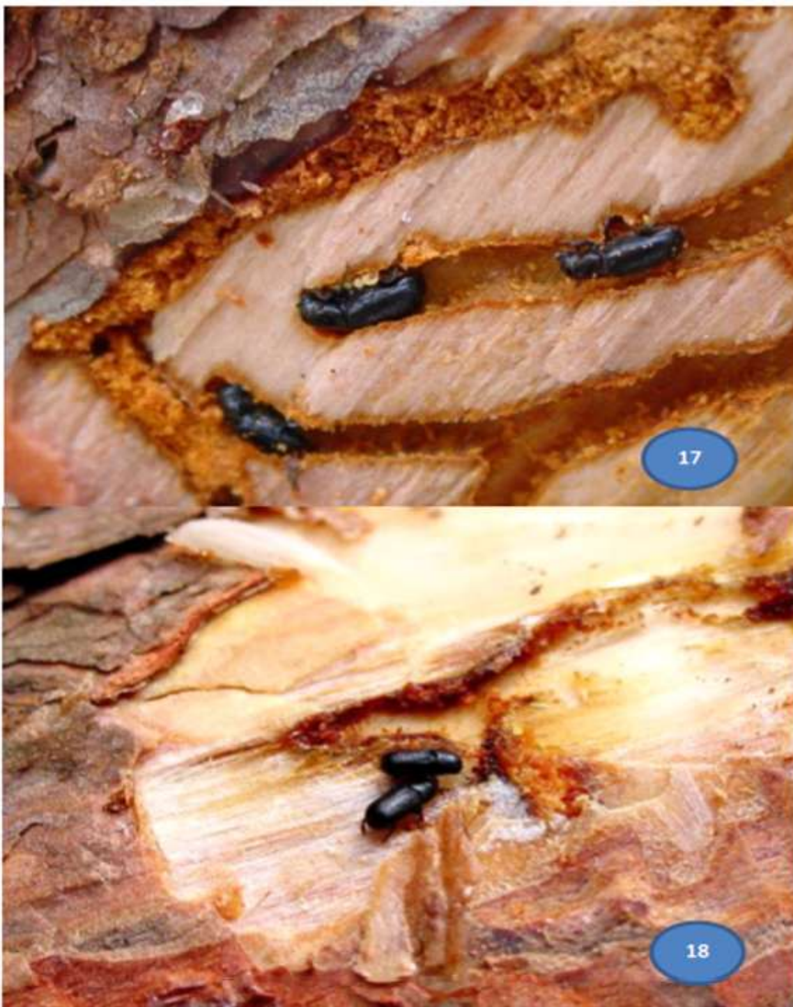
Fotografía 17 y 18.- Adulto, última etapa de desarrollo del descortezador, de cuerpo robusto con coloración café claro a café oscuro, de diferentes tamaños dependiendo la especie, el cual puede ir de 2.2 a 9.0 mm.