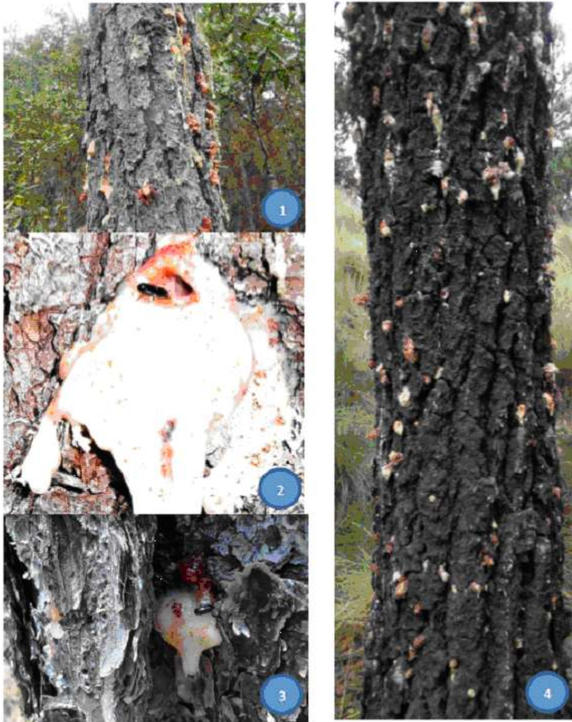
Fotografías 1, 2, 3 y 4. Presencia de grumos de resina, de color blanco y rojizo sobre el fuste del arbolado. Estos grumos también pueden encontrarse sobre ramas.